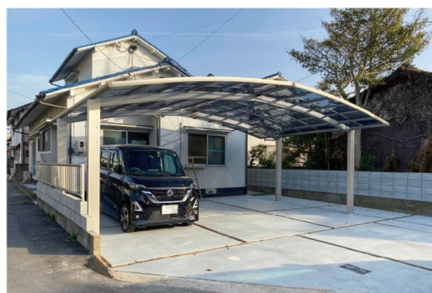
カーポートの設置工事（外構工事）