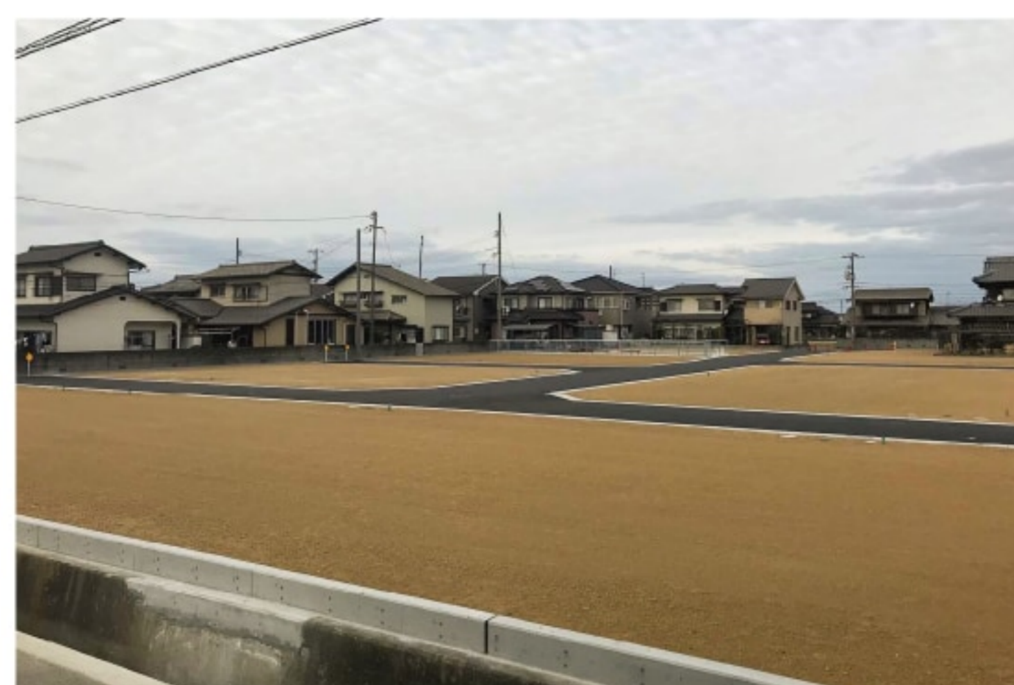
家を建てるための宅地造成工事

一般住宅の新築・増改築（リフォーム）工事 宅地造成 外構工事 コンビナート内工事 空き家・遊休地利活用支援 ソーシャルビジネス・地域おこし協力隊の支援